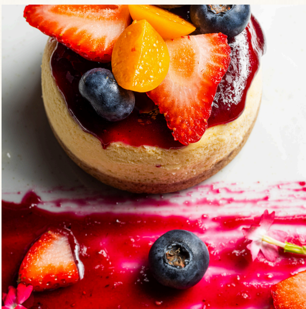
CHEESECAKE FRUTOS DEL BOSQUE

Base de galleta crocante, rellena con crema de limón y leche condensada, decorada con merengue italiano.