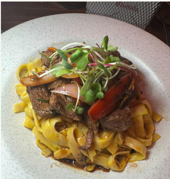
FETUCCINI A LA HUANCAÍNA CON LOMO

Sopa de pechuga de pollo, verduras y cabello de ángel.